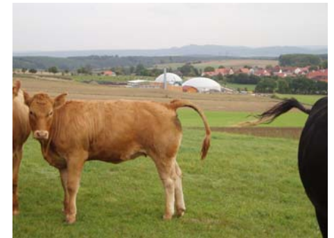
Bioenergieranlage in Jühnde

Tagung am 16. Juni 2006, 13 30 – 17 30 Uhr im Rahmen der Einweihungsfeier der Bioenergieranlage